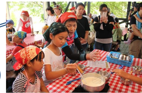
青年部と女性会が協力して取り組んだ食育活動

総合事業を通じて地域の生活インフラ機能の一翼を担い、協同の力で豊かで暮らしやすい地域社会の実現に貢献する