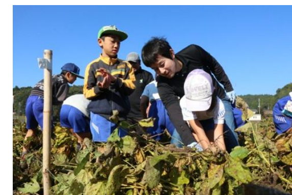
子ども達を対象に収穫体験を実施。農と食の大切さを伝える取り組みを行っています。