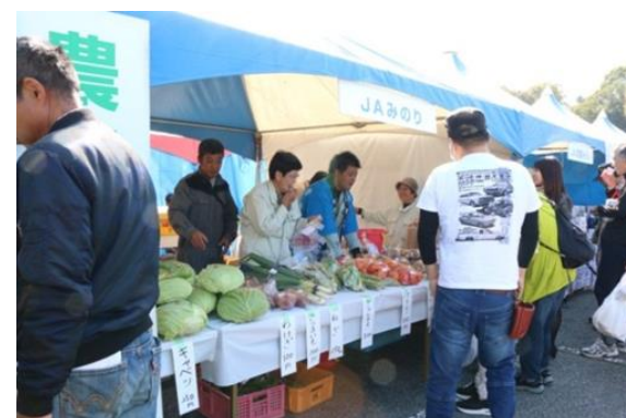
イベントなどに参加し、地域とのふれあいに取り組んでいます。