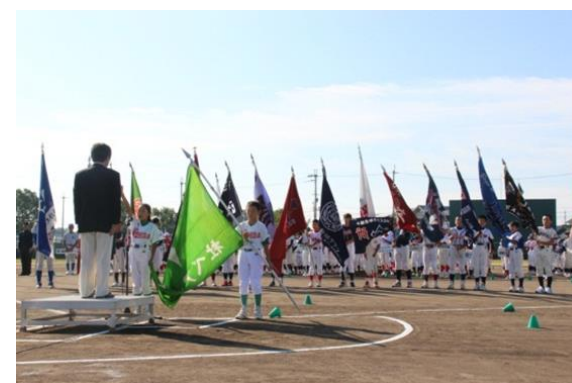
子どもの健やかな成長を願い、少年野球大会やサッカー大会を開催しています。