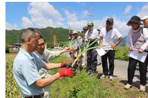
地域振興作物の生産拡大のため、各作物ごとに栽培講習会を行っています。