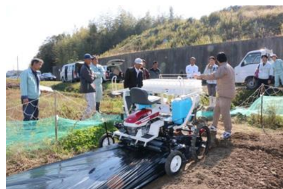
農作業の効率化と生産拡大のため、機械リース事業を行っています。