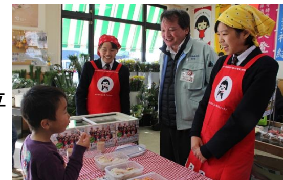
高校生と共同開発したサラダチキンを発売