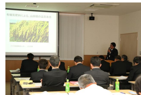
各種展示図を設置し、生産技術などの向上を図っています。