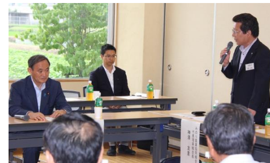
菅官房長官と意見交換する神澤組合長(右)

消費者の信頼にこたえ、安全で安心な農畜産物を持続的・安定的に供給できる地域農業を支え、農業者の所得増大を支える