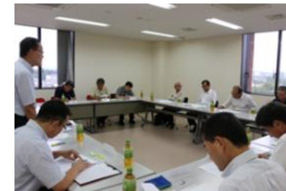
地区別ふれあい委員会を開催。地域の活性化に向け意見交換を行っています。