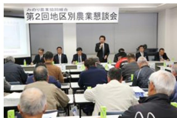
地区別農業懇談会を開催。農業担い手の意見を集約し、JA事業に反映しています。